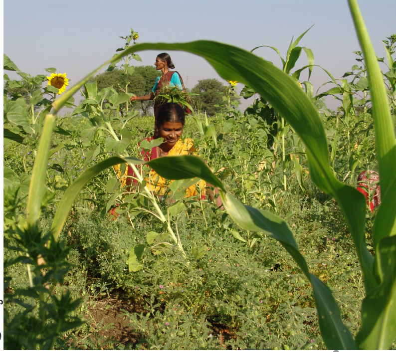
■ ಕೃಷಿಯಲ್ಲಿ ಜೀವವೈವಿಧ್ಯವನ್ನು ಪೋಷಿಸುವುದು

ಆ ಧ್ಯಪದೇಶದ ಮದಕ್ ಜಿಲ್ಲೆಯ ಆರ್ಥಿಕವಾಗಿ ಹಿಂದುಳಿದ ದಲಿತ ಕುಟುಂಬಗಳ ಸಣ್ಣ ಹಾಗೂ ಅಂಚಿನ ಮಹಿಳಾ ಕೃಷಿಕರೊಂದಿಗೆ ಡೆಕ್ಕನ್ ಡೆವಲಪ್‌ಮೆಂಟ್ ಸೊಸೈಟಿಯು ಕಳೆದ ಎರಡು ದಶಕಗಳಿಂದ ಕೆಲಸ ಮಾಡುತ್ತಿದೆ. ತಮ್ಮ ಕೃಷಿ ಕುರಿತು ಮಹಿಳೆಯರು ಪ್ರಸ್ತಾಪಿಸಿದ ವಿಚಾರಗಳನ್ನು ಪರಿಶೀಲಿಸಿ ಸೊಸೈಟಿಯು ಸೌಕರ್ಯ ಒದಗಿಸಿತು. ಈ ಲೇಖನವು ಅಂತಹ ಕೆಲವು ವಿಚಾರಗಳನ್ನು ಹೇಳುತ್ತದೆ. ಸಾಂಪ್ರದಾಯಿಕ ಕೃಷಿ ಆರ್ಥಿಕತೆ ಮತ್ತು ವಿಜ್ಞಾನಿಗಳ ಚರ್ಚೆಗಳನ್ನು ಮತ್ತು ಆಹಾರದ ಮೇಲಿನ ದೃಷ್ಟಿಕೋನ, ಕೃಷಿಯ ಹುಟ್ಟು ಮತ್ತು ನೆಲದ ಮೇಲಿನ ಪೋಷಣೆಯ ಕುರಿತಾಗಿ ಪ್ರಸ್ತುತಪಡಿಸಿದ ಅಭಿಪ್ರಾಯಗಳನ್ನು ಅದು ಬದಲಿಸಿತು.